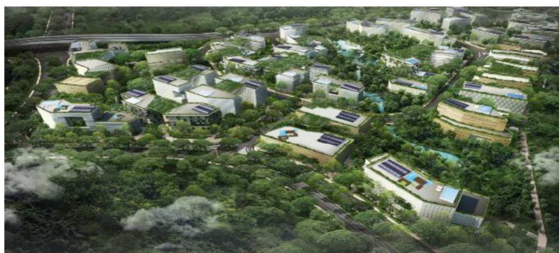
Exemple de CleanTech

Ces réflexions s'adressent aux décideurs du secteur public ainsi qu'aux professionnels qui travaillent avec les collectivités sur des projets de développement urbain ; Quelle ville pour demain? (Sensible, intelligente, durable), Quelles solutions pour économiser l'énergie ? (Bâtiments intelligents) et pour ceci un projet intelligent pour ma ville afin d'améliorer ses performances.